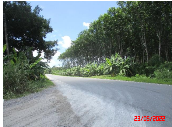
รูปที่ 2-27 จุดขังน้ำหน้าถาวรทุก