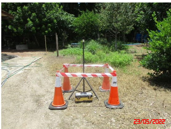
บ้านไสมุดด้านทิศเหนือ