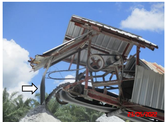
ถังครอบปลายสายพานลำเลียง