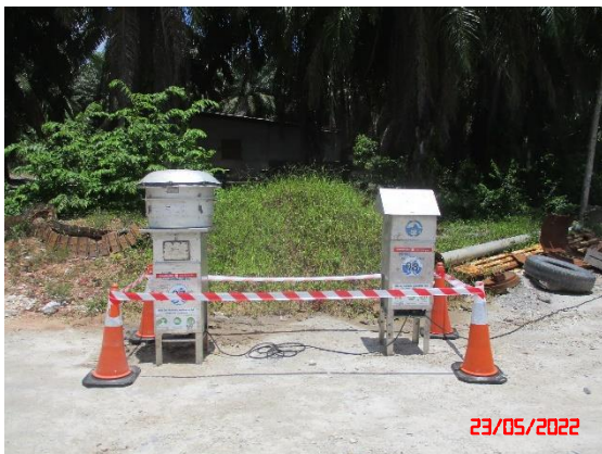
สำนักงานโรงแต่งแร่ของโครงการ