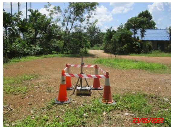
บ้านโคกมนด้านทิศใต้