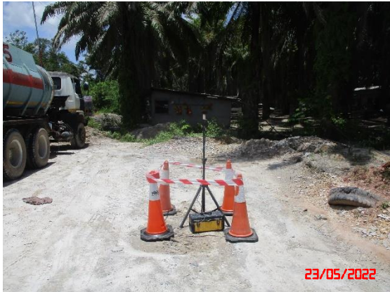
สำนักงานโรงแต่งแร่ของโครงการ