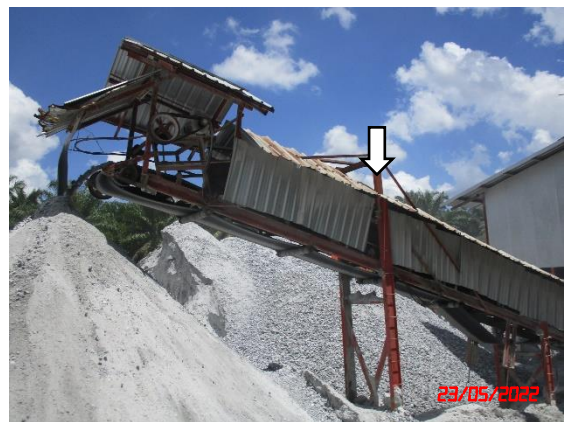
หลังคาปิดคลุมสายพานลำเลียง