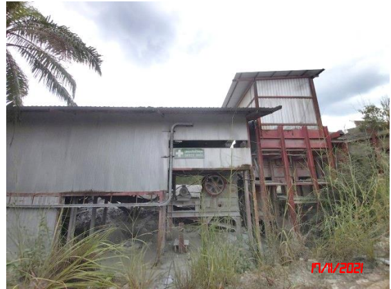
อาคารปิดคลุมโรงไหมหิน 3 ด้าน