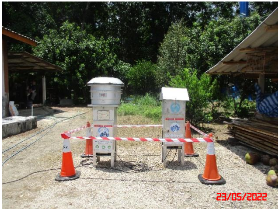
บ้านไสมุดด้านทิศเหนือ