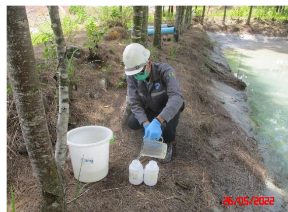
บ่อดักตะกอนของโครงการ