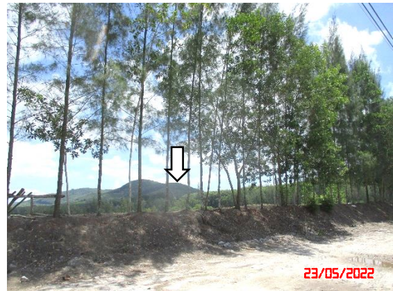
รูปที่ 2-8 คูระบายน้ำ