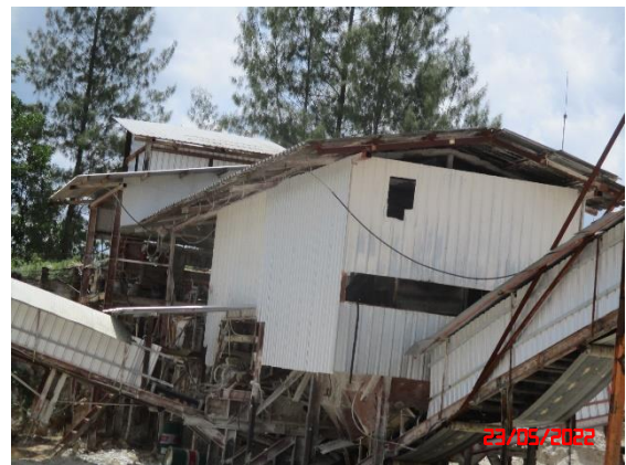
รูปที่ 2-5 อาคารเก็บวัตถุดิบ