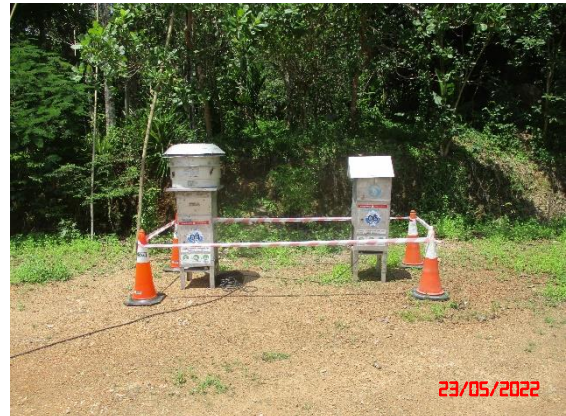
บ้านโคกมนด้านทิศใต้