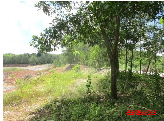
รูปที่ 2-4 โรงแต่งแร่