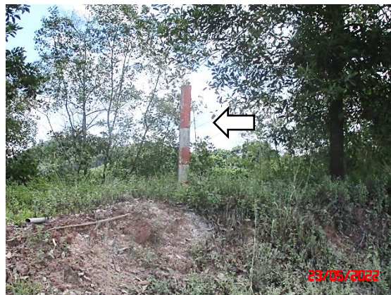
รูปที่ 2-3 แนวเวนไม่ทำเหมืองระยะ 10 เมตร