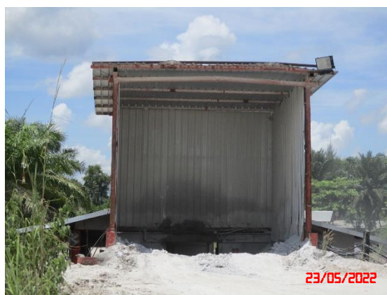
อาคารปิดคลุมอยู่รับแร่