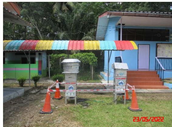
โรงเรียนบ้านห้วยริน