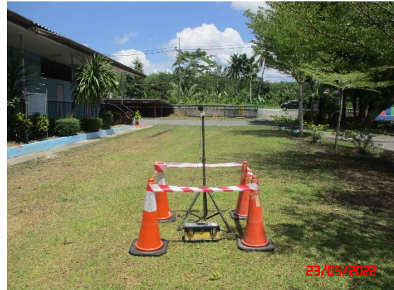
โรงเรียนบ้านห้วยรีน