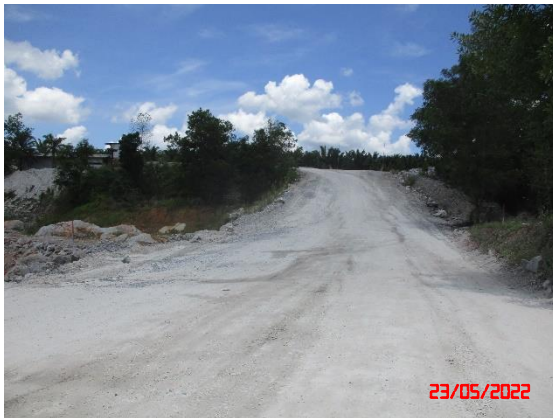
รูปที่ 2-11 เส้นทางลำเลียงแร่