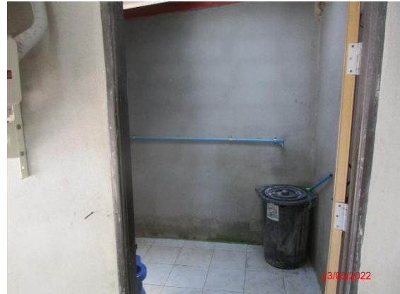
รูปที่ 2-31 ภาชนะรองรับขยะ