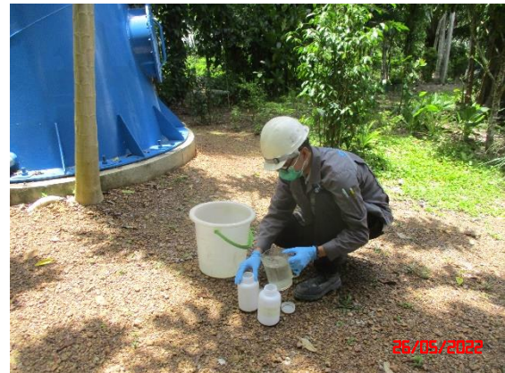
น้ำบาดาลบ้านไผ่ผุด