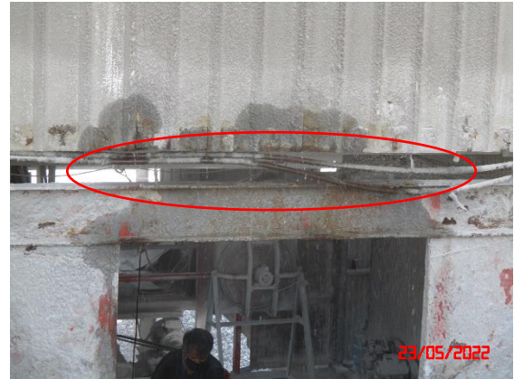
ระบบประปาบริเวณแหล่งกำเนิดฝุ่นละออง